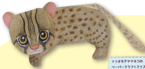
イリオモテヤマネコの ペーパークラフトクイズ! 沖縄のどこの島に生息している?