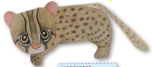
イリオモテヤマネコのペーパークラフトクイズ! 沖縄のどこの島に生息している?

絶滅危惧種のイリオモテヤマネコをペーパークラフトで作ってみよう! 完成したら「イリオモテヤマネコ」をポプラディアで調べてみてね!