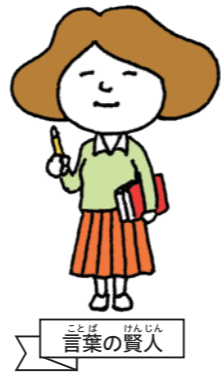
ことば 言葉の賢人